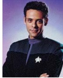
סגן ג'וליאן באשיר - קצין רפואה ראשי

מנהל בר פרנגי כדמות קבועה בסדרת "מסע בין כוכבים". משפט זה מתאר אולי בתמצות את אחד ההבדלים בין "חלל עמוק תשע" לסדרות הטרק שקדמו לה. קווארק אינו נחמד (לפחות, לא כל הזמן). הוא לא מנומס. לא ממש אכפת לו רוב הזמן מאחרים. כנראה שהוא לא היה משתלב טוב על סיפונה של האנטרפרייז.