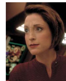
רס"ן קירה נריס - קצינה ראשונה מגולמת על ננה ויזטור

חייו האישיים של סיסקו זכו אף הם לעיסוק בסדרה: תפקידו כאב לבנו, גייק; מערכות היחסים הרומנטיות שלו; חברותו רבת השנים עם דקס, ונושאים אחרים. במיוחד נודעה חיבתו לבייטבול, משחק אנושי העומד בסכנת הכחדה.