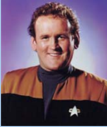
צ'ף מיילס אובראין - קצין המבצעים

אבל טיילת תחנת החלל "חלל עמוק תשע" היא סיפור אחר. שם הפעיל קווארק את הבר שלו עוד מאז ימי הכיבוש הקרדסי, כמו גם משחקי הימורים וחדרי הולוגרמה. שם גם היה מעורב בחיכוכים אין ספור עם שוטר התחנה אודו ונחקר באופן תדיר. עסקאות רבות שביצע היו, אמנם, מפוקפקות וחלקן בלתי חוקיות,