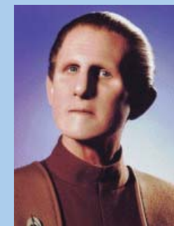
אודו - אחראי ביטחון התחנה מגולם על ידי רנה אוברז'ינוואה

נעשתה מעורבת בפוליטיקה הפנימית הבאג'ורית, ובמקביל נאלצה לבחון פעם ושוב פעם את יחסיה כלפי הקרדסים. נוסף על כך, בתור נציגתה של יישות ריבונית, נאלצה קירה להתמודד לא אחת עם האחריות הביורוקרטית הקשה, כאשר הפעם היא בתפקיד הקצינה במדים ולא בתפקיד פורעת החוק. אם לא די בכל זאת, הרי שמערכות היחסים בחייה האישיים ידעו קשיים מיוחדים במינם.