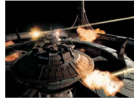
העונה השישית מלחמה

שאפשרה לשלב את שחקני "חלל עמוק תשע" בסצינות מתוך הפרק הקלאסי The Trouble With Tribbles. במהלך הפרק קרו התרחשויות מיוחדות כגון מפגש בין קפטן סיסקו לקפטן קירק, והעובדה שוורף נאלץ להתחמק מתשובה לשאלה מדוע הקלינגונים במאה ה-23 נראים כל כך שונים.