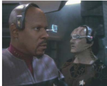
העונה השביעית מהלכי הסיום

הרומולנים אכן מצטרפים בסופו של יום לעזרת הפדרציה, אך סיסקו נותר לבדו בהתמודדות עם מצפונו. מעניין לציין, שגם בפרק הקלאסי The Enterprise Incident, מהסדרה המקורית, השתמש צי הכוכבים בשיטות מרמה כנגד הרומולנים, לשם השגת מטרת צבאיות.