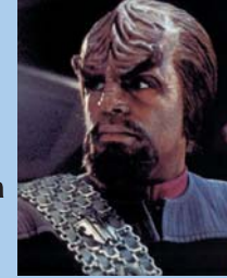
קומנדר וורף - קצין מבצעים אסטרטגיים